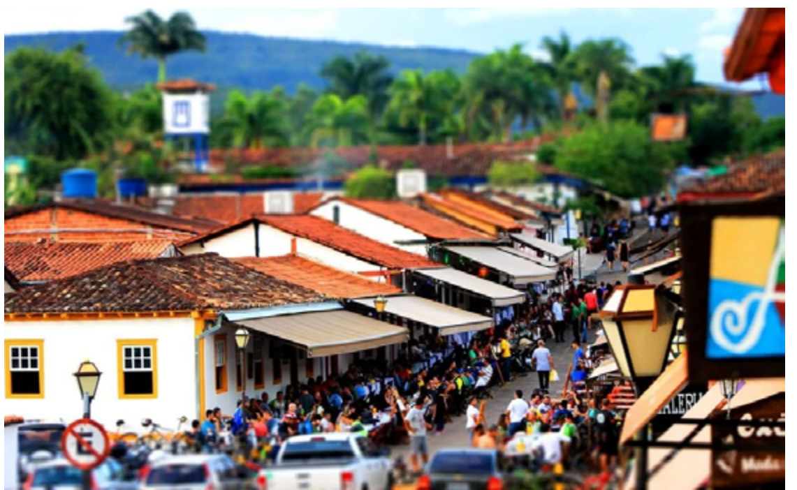
O Festival conta com o apoio do SINDTUR (Sindicato de Turismo e Hospitalidade de Goiás) e da São Bento Produções

Além da participação de chefs locais, o evento receberá renomados chefs da culinária nacional, como Jimmy Ogro e Carlos Bertolazzi. Estão programadas aulas-show e atividades interativas com a comunidade, enriquecendo ainda mais a experiência gastronômica e cultural do festival.