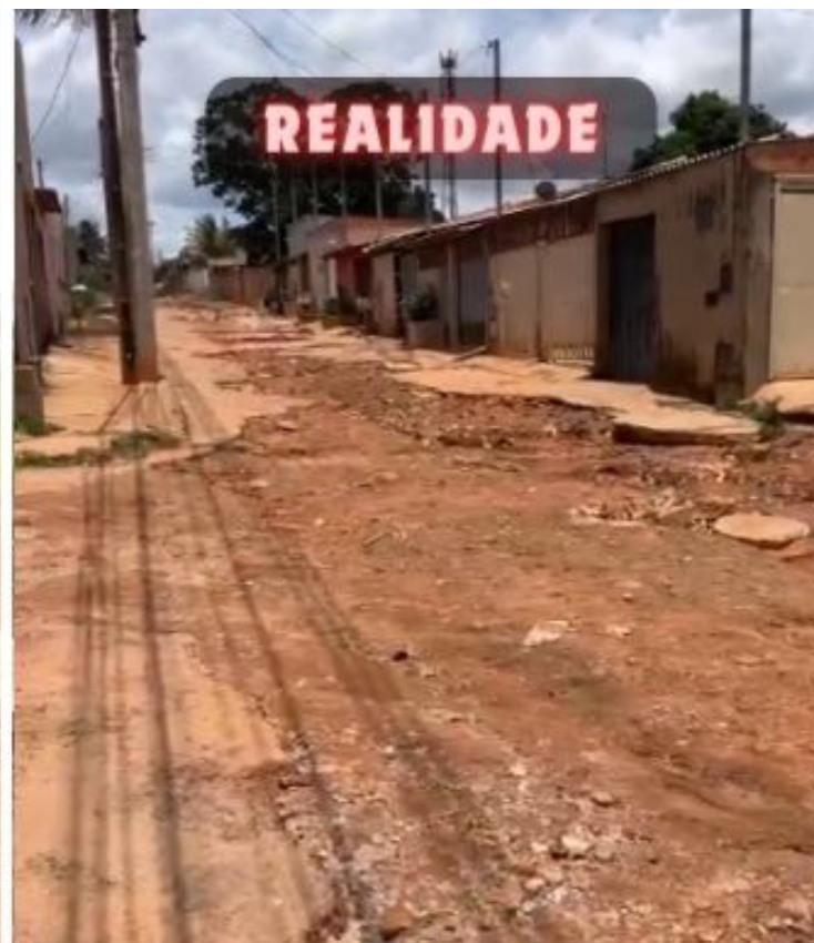
Diferença entre a propaganda do governo Pábio Mossoró, em Valparaíso de Goiás, e a realidade vivida por parte da população

A última inauguração ocorreu na segunda-feira (25), com a divulgação da construção de duas pontes, com a presença do prefeito e de outros políticos locais, cujas imagens foram amplamente divulgadas nas redes sociais. No entanto, contratos anteriores para essas obras já previam um prazo de conclusão que não foi cumprido, levantando questionamentos sobre a real intenção