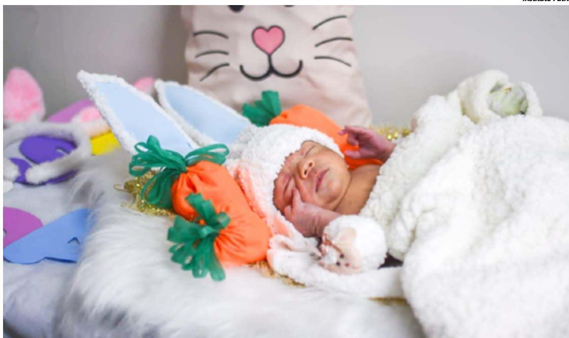
Um dos bebês nascidos no Hospital Estadual de Luziânia enfeitado com motivos da Páscoa

As brincadeiras de enfeitar os bebês já são tradição no hospital. As equipes apro-