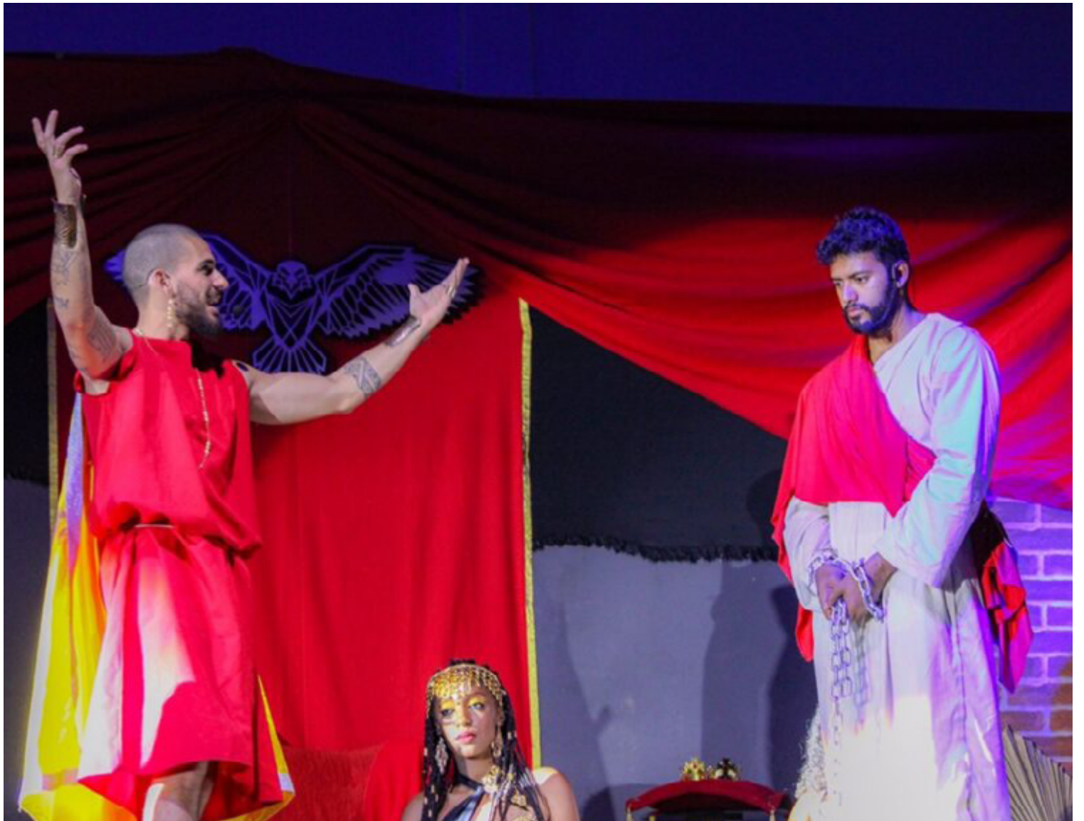
O espetáculo, promovido pelo grupo de oração Cristo Jovem, conta com um elenco composto por mais de cem pessoas

Neste ano, a encenação trará novas cenas da vida pública de Jesus e contará com uma parte musical em colaboração com a banda Cristo Jovem. Este evento promete ser mais um momento de reflexão e espiritualidade para os fiéis de Cristalina e região.