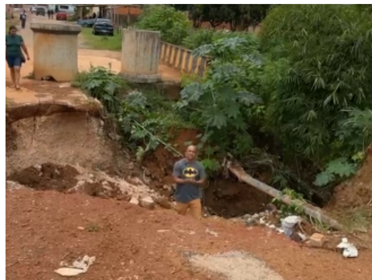
O colapso da estrutura deixou um bairro praticamente isolado, obrigando as pessoas a atravessarem a ponte por um pequeno espaço restante

Diante desse cenário, a comunidade também exige transparência e ações concretas por parte das autoridades responsáveis para resolver esses problemas urgentes e garantir condições de vida dignas para todos os cidadãos.