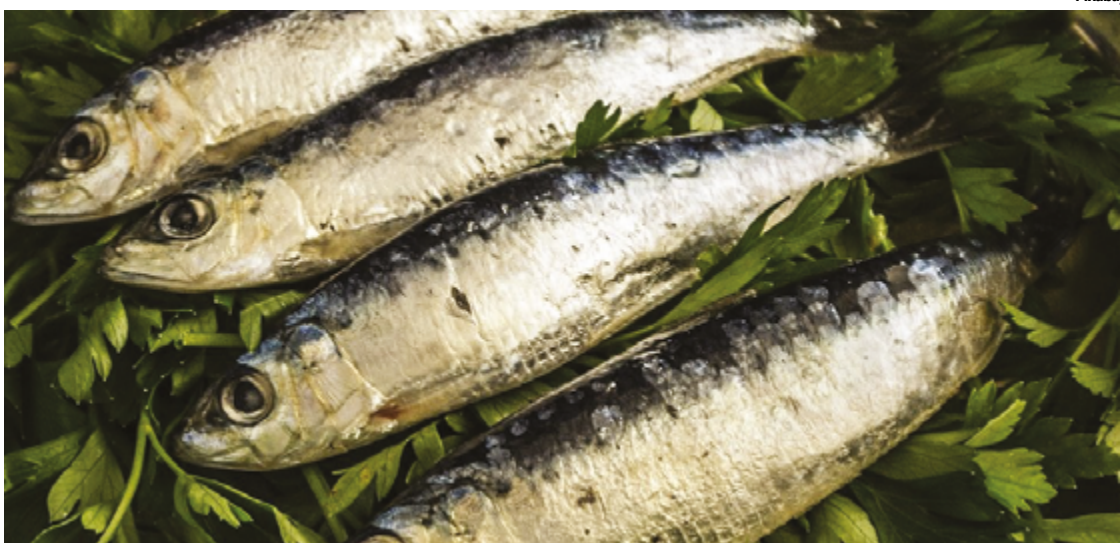
Consumo de peixe vem de diversas culturas, não apenas no sentido religioso, mas também por seus benefícios à saúde

ela, se estendem para áreas vitais e podem ajudar na promoção de longevidade. "A importância nutricional se estende aos ácidos graxos ômega-3, encontrados em muitas variedades de peixes, conhecidos por seus efeitos benéficos para a saúde cardiovascular e cerebral", afirma.