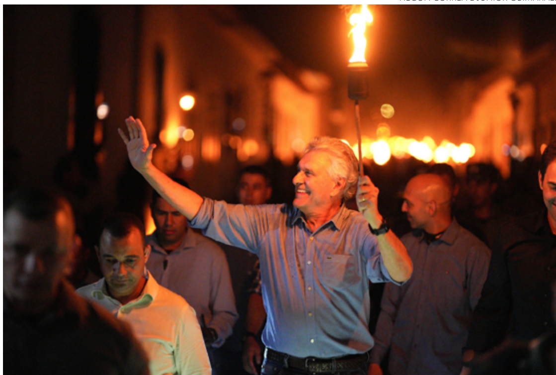
Ronaldo Caiado durante percurso pelas ruas: governador enalteceu procissão e valores da goianidade

O governador segurou uma tocha e realizou todo percurso da