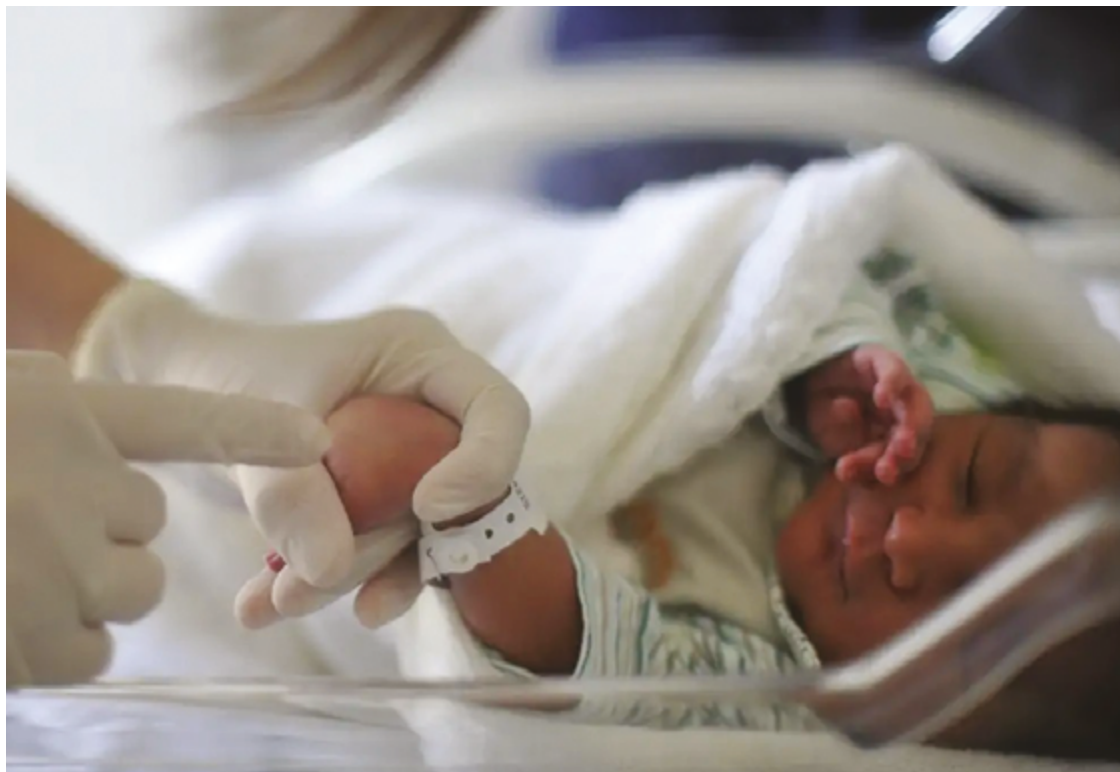
Última vez que quantidade de nascidos esteve no patamar atual foi há 14 anos; indicativo estava em queda desde 2018

tre as cidades com maior índice de queda nos nascimentos, mas cidades próximas