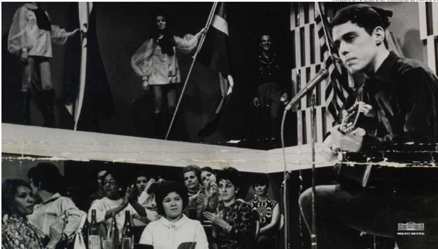
Chico Buarque faz show na extinta TV Rio, em agosto de 1967: artista se exilou dois anos depois e foi um dos mais censurados na música popular brasileira

Eram frequentes visitas a shows, intimações a depoimentos forçados e censura a canções. Hoje, aos cuidados do Arquivo Nacional, os documentos - que podem ser obtidos via Lei de Acesso à Informação pela sociedade civil - detalham ainda quando os