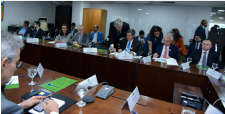
Ronaldo Caiado reitera compromisso do Governo de Goiás de zerar desmatamento ilegal no estado até 2030