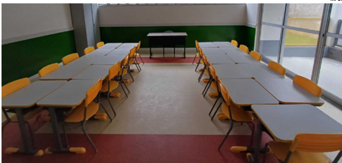
Salas de aula também estão em construção em outra escola