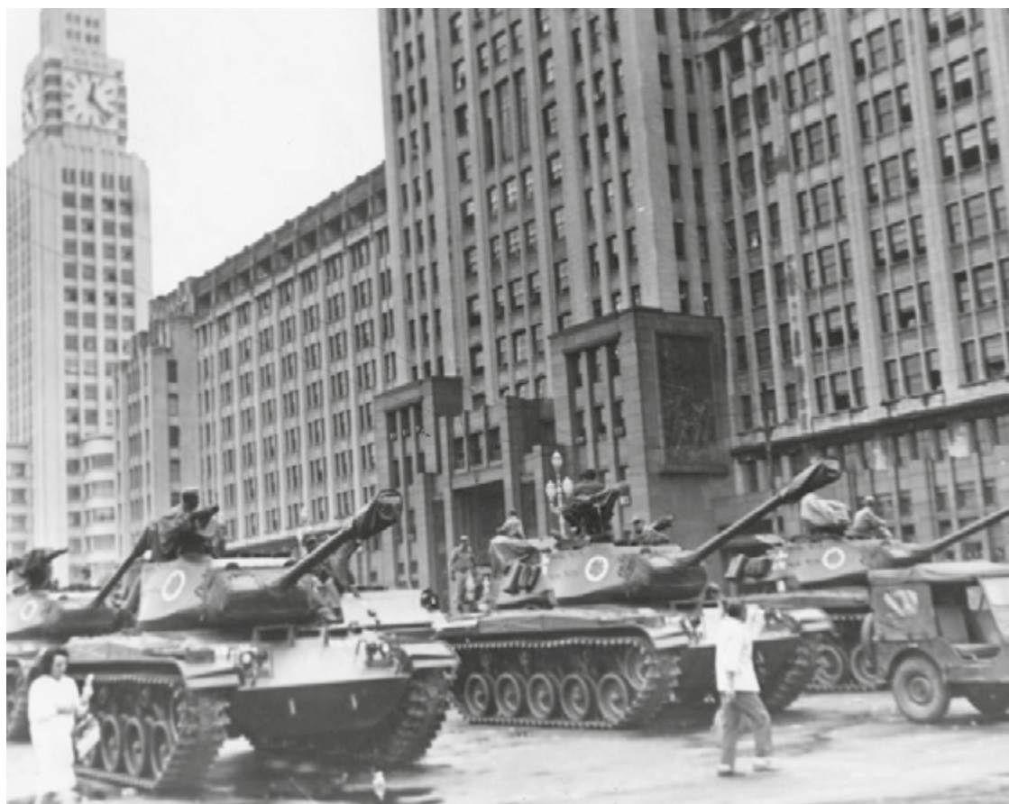
Mobilização de tanques no Rio de Janeiro em abril de 1964

Nos dias que antecedem o golpe, havia diferenças de opinião entre os militares — enquanto um grupo, majoritário, queria sua queda e acreditava nessa possibilidade, outras facções viam a ruptura com ceticismo, e outros ainda apoiavam as reformas de base do