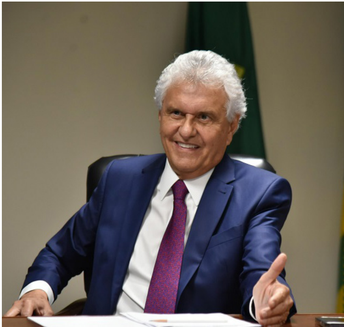
Ronaldo Caiado avança junto ao eleitorado da direita para as eleições presidenciais

Em recente entrevista à Folha de S. Paulo, Caiado considerou que tem o mesmo eleitorado de Bolsonaro e disse que pretende trabalhar para viabilizar seu nome na disputa pelo Palácio do Planalto em 2026 com o apoio do ex-presidente, isso, claro, se o liberal não tiver