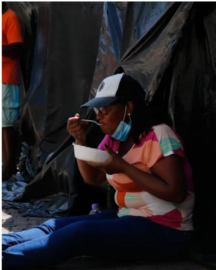
Sensação de insegurança ao caminhar durante a noite nas cidades brasileiras aumentou nos últimos seis meses

Houve uma diminuição equivalente na quantidade de brasileiros que respondem sentir-se “mais ou menos seguros” nas ruas da própria cidade: