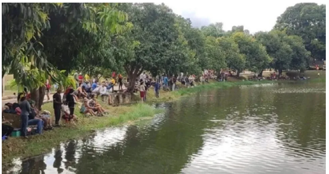
Foram disponibilizados 500 kg de tambaqui e 500 kg de caranha para a população pescar e levar para casa

Além disso, a prefeitura assegura que haverá reforço na segurança com maior presença policial no local, visando proporcionar um ambiente agradável e seguro para que as famílias de Trindade desfrutem da pescaria de maneira gratuita, em um cenário de convívio familiar, cercado por áreas verdes.